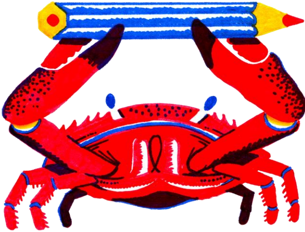
illustrazioni: Luogo Comune progetto grafico: studio +fortuna

Luogo Comune è un illustratore e urban artist italiano. Ha realizzato progetti per esterni e interni con grande varietà di tecniche.